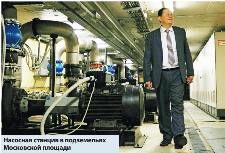
Насосная станция в подземельях Московской площади